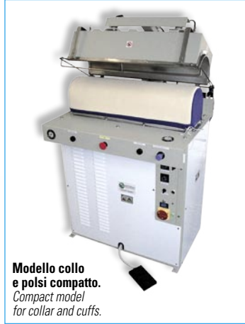
Modello collo e polsi compatto. Compact model for collar and cuffs.